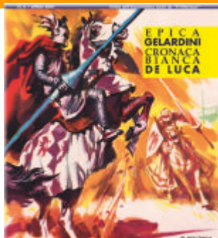
Copertina VITT&amp; dintorni n. 5